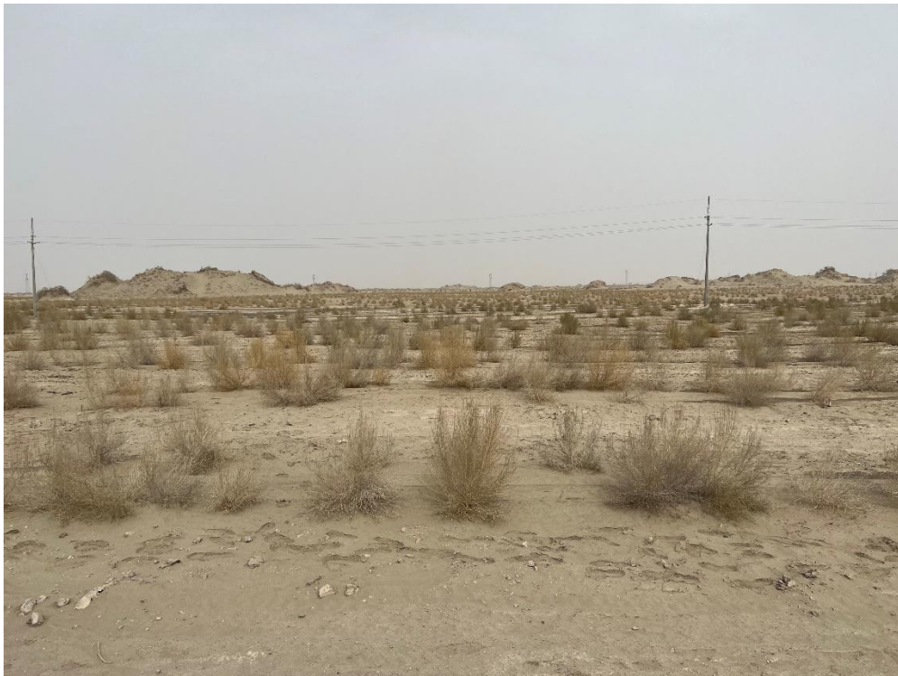
图 1 肉苁蓉接种及采收试验布置区域